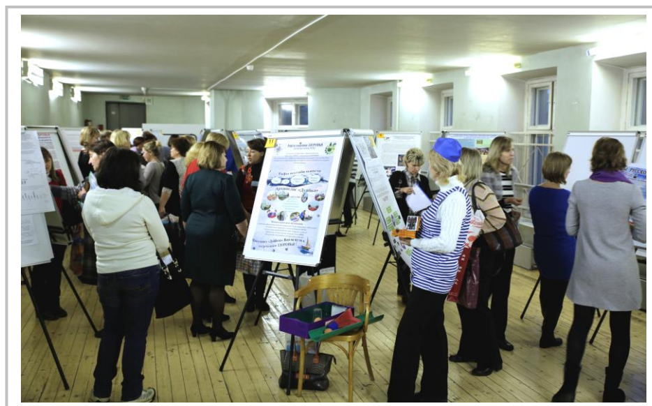
Стендовая сессия городской научно-практической конференции «Проблема сохранения и укрепления здоровья обучающихся и воспитанников в условиях введения ФГОС»

К сожалению, такой важный аспект как «сохранение здоровья педагогов» встречается всего в 30% программ. Также редко в программах встречается раздел «работа с детьми, имеющими ограниченные возможности здоровья» (30%).