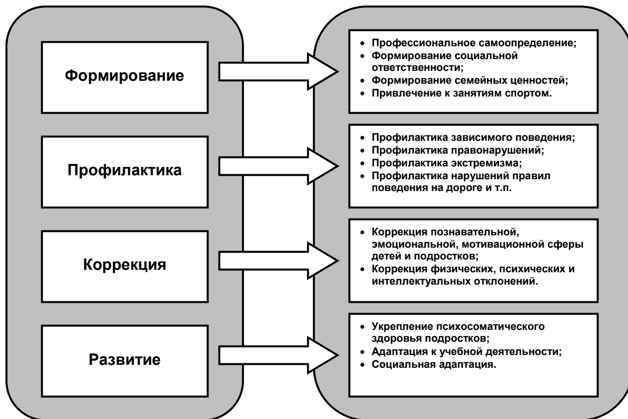
Рис.1. Направления деятельности образовательных учреждений по сохранению здоровья обучающихся и воспитанников

его повторения при последующей реализации сетевого взаимодействия.