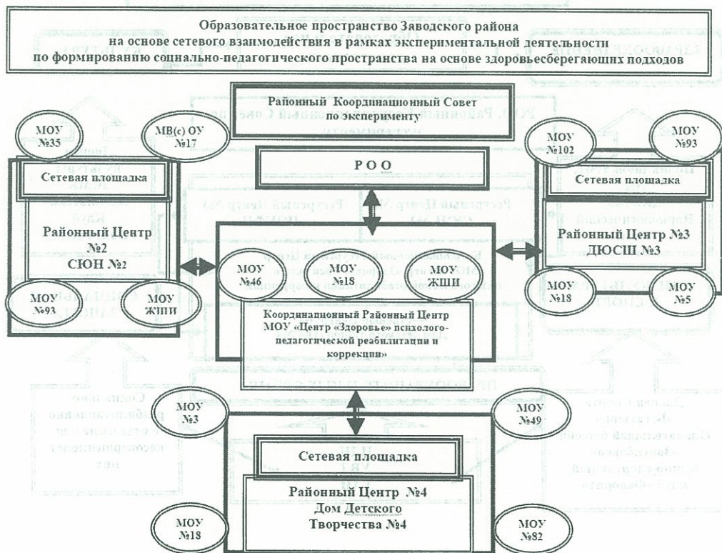
Схема сетевого взаимодействия образовательных учреждений по формированию социально-педагогического пространства на основе здоровьесберегающих подходов

Вокруг каждого «Ресурсного Центра» объединились образовательные учреждения с целью удовлетворения своих образовательных запросов по приоритетным направлениям здоровьесберегающей деятельности.